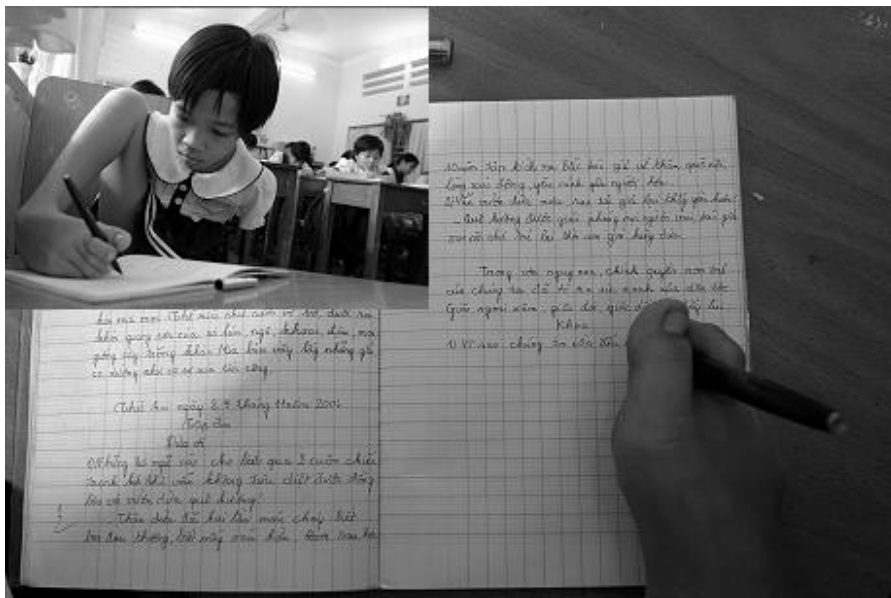
Née sans bras, cette petite fille n'a pas eu d'autre choix que d'apprendre à écrire avec ses orteils.

Aujourd'hui, à l'approche du trentième anniversaire de la fin de la guerre du Vietnam, environ 60.000 adultes et plus de 200.000 enfants (1) souffrent toujours de « l'agent Orange » (2). Malformations congénitales, cancers, handicaps physiques et mentaux, sont dans la majorité des cas, la conséquence des plus de 70 millions de litres de défoliants dont le célèbre « agent Orange », déversé au centre et Sud Vietnam de 1961 à 1971 par l'armée américaine. Pays agricole, 20 % du sol vietnamien ont reçu quelque 170 kg de dioxine (3). En plus des combattants de tous bords, la population civile fut durement touchée. À New York, va s'ouvrir le plus grand procès jamais mené aux Etats-Unis contre les responsables du gouvernement et des industries chimiques concernés (4). Les associations de victimes, représentées par des avocats américains, demandent réparations et justice. Les implications et les conséquences sociales, économiques et financières de ce procès sont considérables au regard de la plus grande guerre chimique de l'histoire.