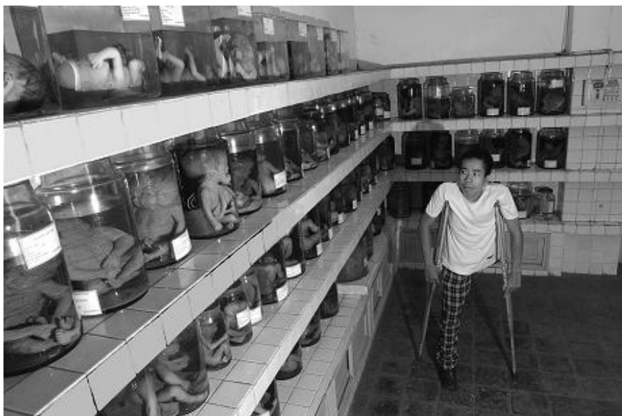
Des foetus malformés, conservés dans des bocaux en verre, remplissent des étagères entières à l'Hôpital Tu Du, Hô Chi Minh-Ville.

Le taux de dioxine chez les Vietnamiens du Sud est 900 fois plus élevé que celui des Vietnamiens du Nord (7).